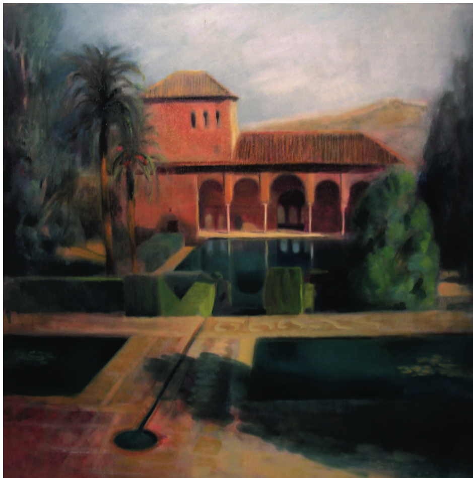
La Alhambra, Granada. Óleo sobre lino. 50 x 50 cm.