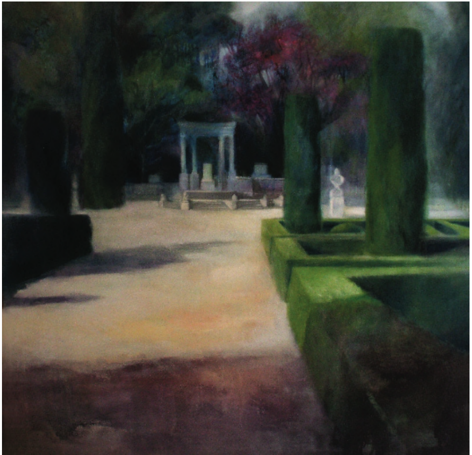
Los Jardines del Capricho, Madrid. Óleo sobre lino. 100 x 100 cm.