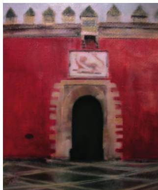
Puerta del León, Alcázar de Sevilla.