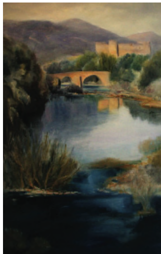
El Castillo de Valdecomeja, Ávila.