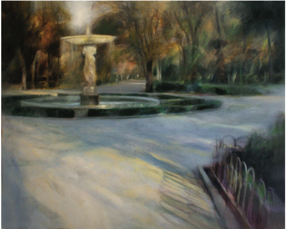
Parque del Retiro, Madrid. Óleo sobre lino. 100 x 81 cm.