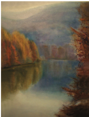
La Selva de Irati, Navarra.