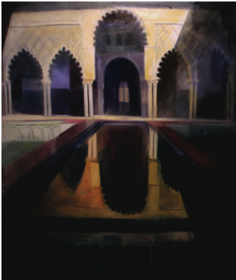
Alegoría. Patio del Alcázar de Sevilla. 81 x 100 cm.