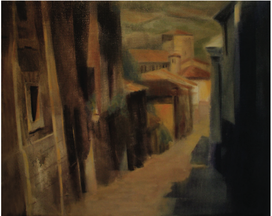
Santillana del Mar, Cantabria. Óleo sobre lino. 46 x 55 cm.