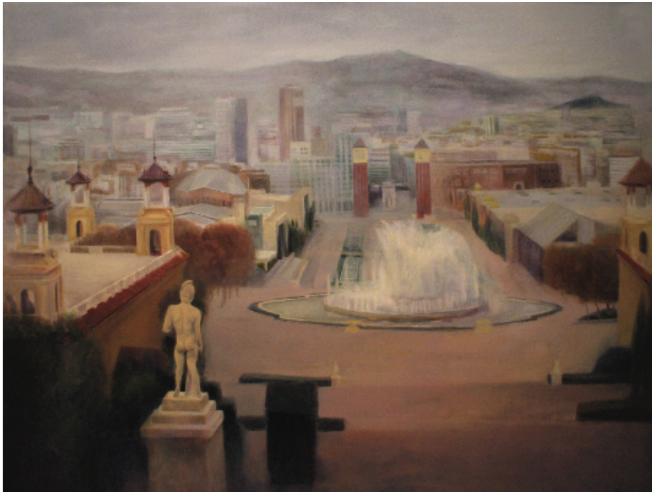
Barcelona desde el Palacio de San Jorge. Óleo sobre lino. 116 x 89 cm.