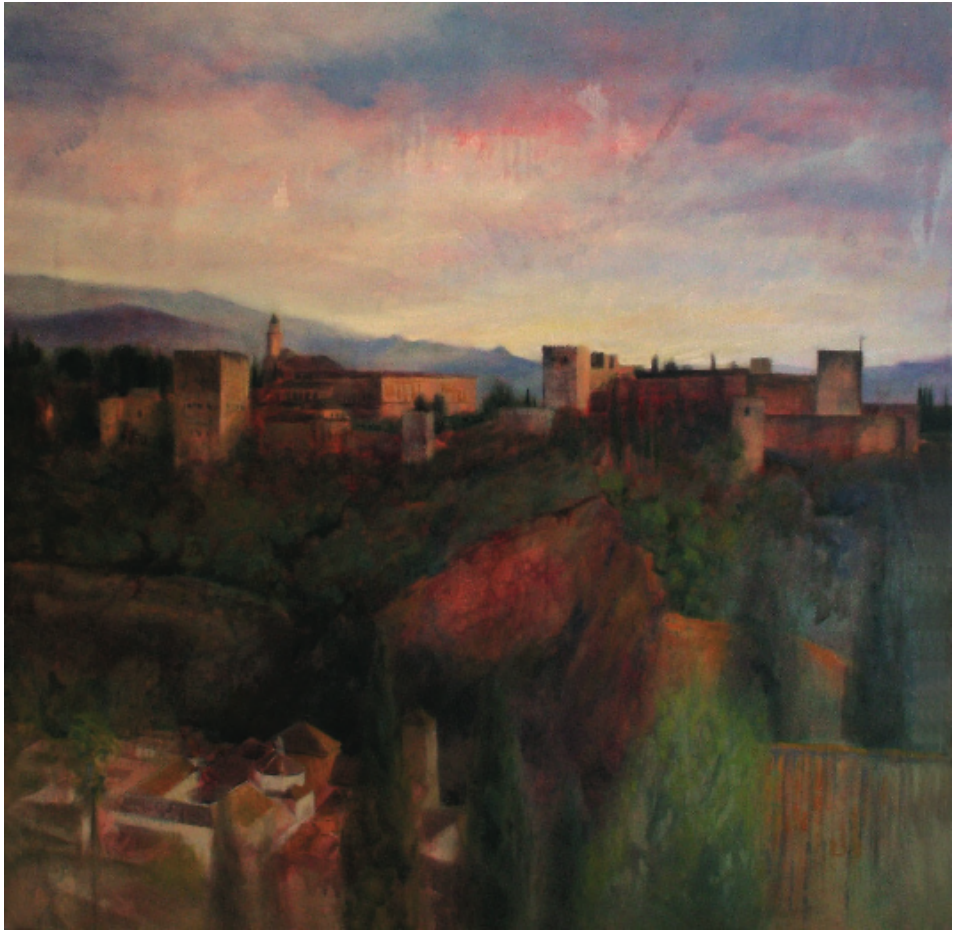
La Alhambra, Granada. Óleo sobre lino. 100 x 100 cm.