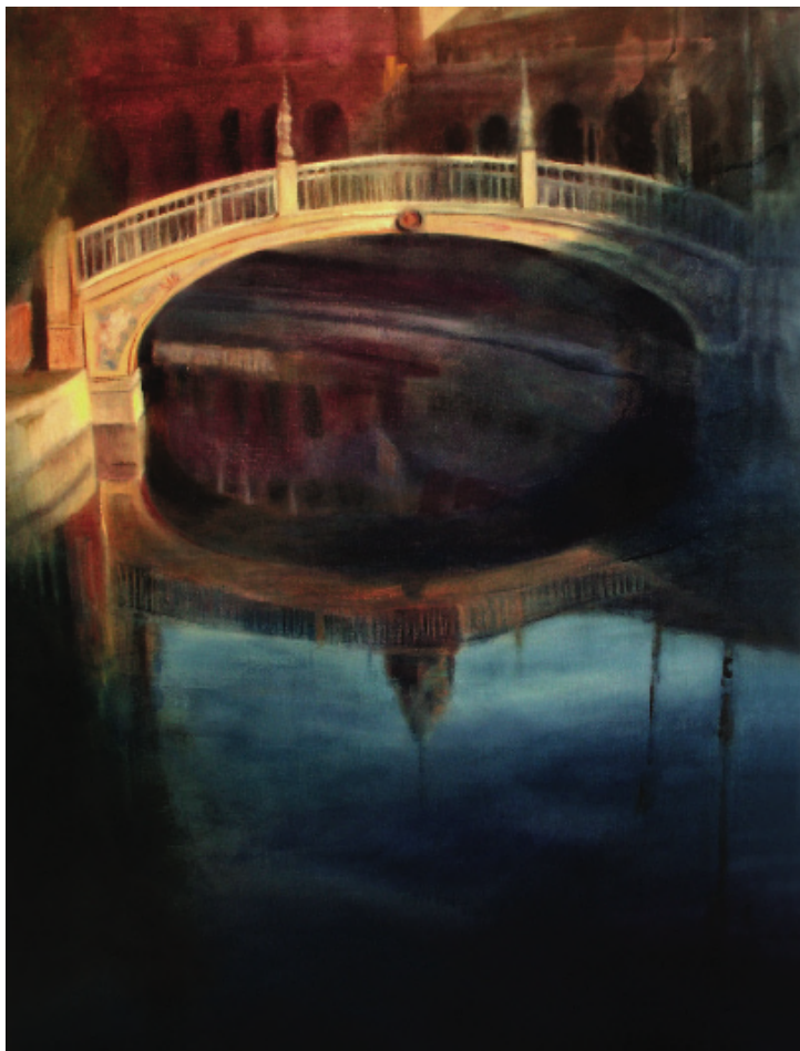
Plaza de España, Sevilla. Óleo sobre lino. 100 x 76 cm.