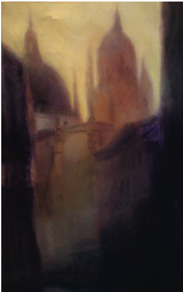
Contraluz, Segovia. Óleo sobre lino. 37 x 69 cm.